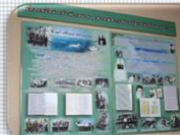
Экспозиция «Легендой светлой и прекрасной звучит ваш выбор!» («Клуб Юный авиатор», «Династия лётчиков Шелыгановых»)