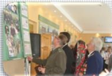
Экспозиция «Мы родом из 19-й!»