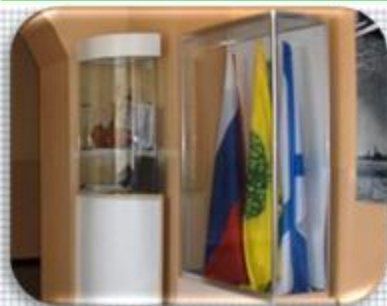
Экспозиции: «Символика Российской государственности и ВВС России»