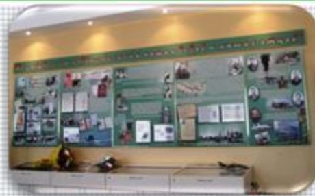
Экспозиция «Не забудем мы подвиг великий наших дедов и наших отцов!» (деятельность ЭКВИ и клуба «Поиск» СШ №19: Боевой путь 50-й Армии)