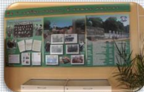
Экспозиция «Вы в сердце нашем, в наших мыслях» (СШ №19 в первом Почётном карауле у obelиска Славы)