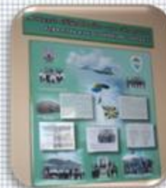
Экспозиция «А жизнь идет, и годы как страницы огромной книги подвигов людских...» (будни Липецкого авиационного центра)