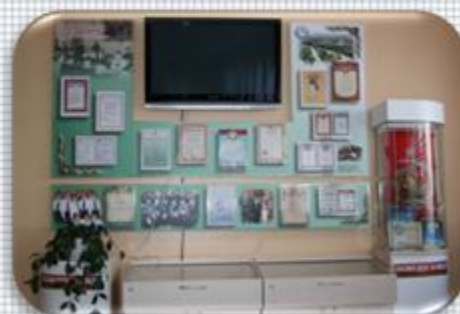
Экспозиция «А то, что жили не напрасно и не напрасно шли вы в бой, в веках идущие достойно докажут собственной судьбой» (героические будни Авиационного центра)