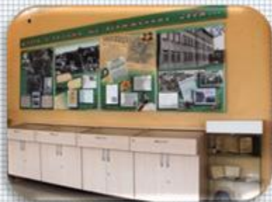
Экспозиция «Учителя СШ №19 и наши семьи в небе военных лет). Экспозиция «Мы письма писали, как летопись боя...»