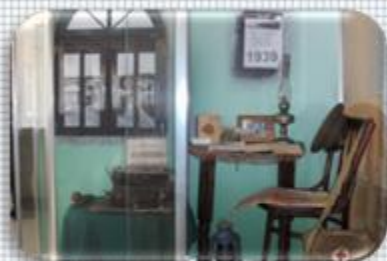
Экспозиция «Обстановка кабинета городской квартиры довоенного времени» (Липецк крылатый)